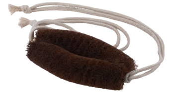
ひも付きタワシ | 背中洗い | 棕櫚 Tawashi with String (back wash, hemp-palm) » 009-8