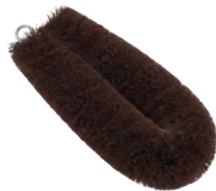
タワシ | スリム | 棕櫚 Tawashi (slim, hemp-palm) » 009-2