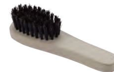
マッサージ用 | ハンドル型 | 猪毛 for Massage (handle type, wild boar hair) » 012-4