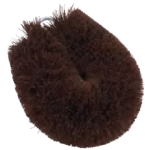
タワシ | ミニ | 棕櫚 Tawashi (mini, hemp-palm) » 009-3