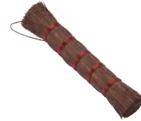
硯洗い | 棕櫚 Suzurirai (washing ink stone, hemp-palm) » 009-7