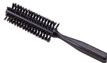
ロールブラシ | 太 | 猪毛 Roll Brush (fat, wild boar hair) » 007-5