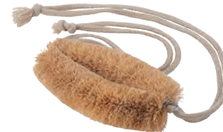
ひも付きタワシ | 背中洗い | パーム Tawashi with String (back wash, palm) » 009-9