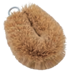
タワシ | ミニ | パーム Tawashi (mini, palm) » 009-4