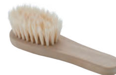
艶出し用 | ハンドル型 | 白豚毛 for Polishing (handle type, white pig hair) » 012-5