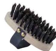
マッサージ用 | 特大 | 猪毛 for Massage (extra large, wild boar hair) » 012-1

Make the time you spend with your pet and enjoyable one. We offer pet brushes for massaging, and for bringing out the luster in their coat. Choose the firmness of the brush fitting for your dog or cat.