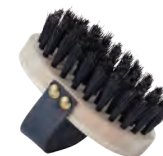
マッサージ用 | ベルト付き | 猪毛 for Massage (with belt, wild boar hair) » 012-2