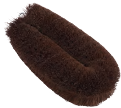
タワシ | 特大 | 棕櫚 Tawashi (extra large, hemp-palm) » 009-1

根強い人気のあるタワシなど。大きさ、用途も様々なタイプをご用意しています。 The scrubbing brushes such as tawashi have a longlasting popularity. We offer various sizes and purposes.