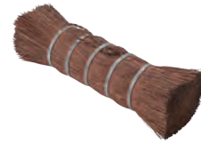
ホーロー洗い | 棕櫚 for Enamel (hemp-palm) » 009-5