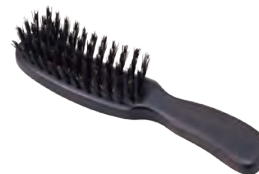
携帯用 | 猪毛 Portable (wild boar hair) » 007-7