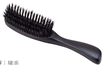
S型 | 猪毛 S-Shaped (wild boar hair) » 007-1

Scalp care is essential to grow beautiful hair. It is best to massage the scalp while combing your hair. Natural bristles stimulate the scalp in a soothing manner. Choose the level of firmness.