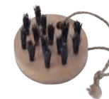
マッサージ用 | 携帯用 | ミニ | 猪毛 for Massage (portable, mini, wild boar hair) » 012-6