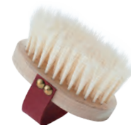
艶出し用 | ベルト付き | 白豚毛 for Polishing (with belt, white pig hair) » 012-3