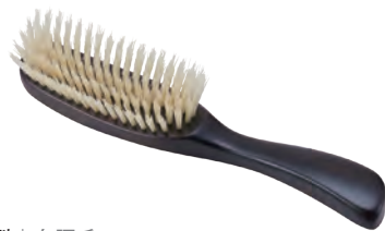
S型 | 白豚毛 S-Shaped (white pig hair) » 007-2