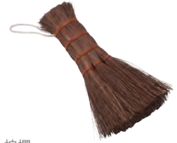
ミニ箒 | 棕櫚 Mini Broom (hemp-palm) » 009-6