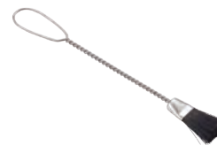
ヘアブラシのお掃除 | 馬毛 Hair Brush Cleaner (horse hair) » 007-9