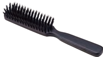
スタンダード | 猪毛 Standard (wild boar hair) » 007-4