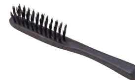
携帯用 | ミニ | 猪毛 Portable (mini, wild boar hair) » 007-8