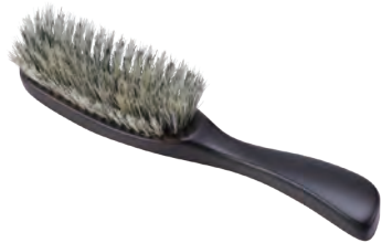
S型 | ゴマ毛 (白豚毛×黒豚毛) S-Shaped (blended hair, white pig hair & black pig hair) » 007-3