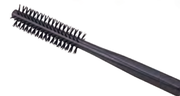
ロールブラシ | 細 | 猪毛 Roll Brush (slim, wild boar hair) » 007-6